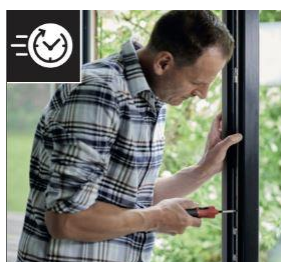
Snabb elektrisk skruvning