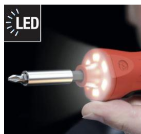
Lysdioder för skuggfri belysning