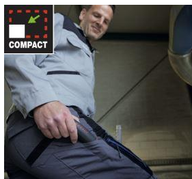
E-skruvmejsel för byxfickan