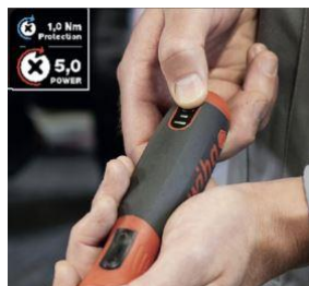
Två effektnivåer – effekt och materialskydd 1,0 Nm | 5,0 Nm