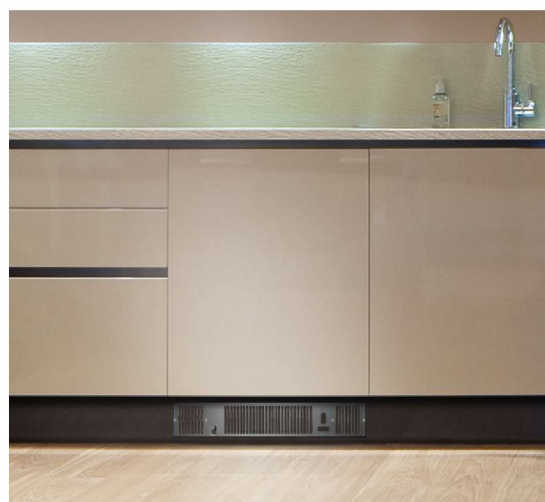
Exempel på galler i svart