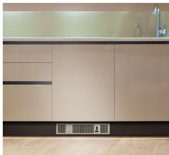
Exempel på galler i borstat rostfritt stål